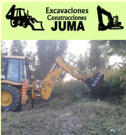
Trabajos de DESBROCE, Movimientos de tierra y Construcción

Para D1 D1+E, D y D+E las terminaciones 5 ó 6 y C1, C1+E, C y C+E las terminaciones 3 ó 4 , ambas de plazo máximo hasta 10 de septiembre 2013 para realizar CAP.